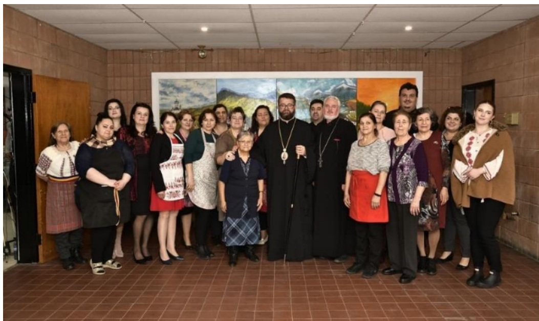
Comitetul de doamne-Hramul „Buna Vestire”-2023

Comitetul de doamne, împreună cu Consiliul Parohial, au pregătit cu multă sârguință și îndemânare gustoasele bucate tradiționale românești, iar atmosfera de sărbătoare a fost întreținută, de artiști renumiți de muzică populară și dans tradițional.