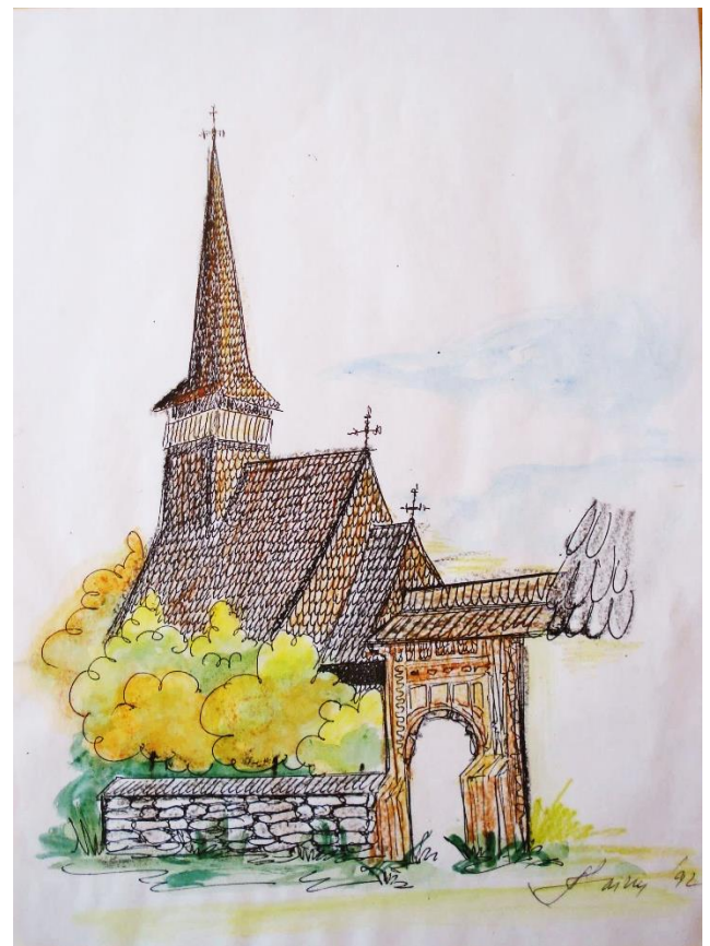
Grafică Angela Faina - Pastel