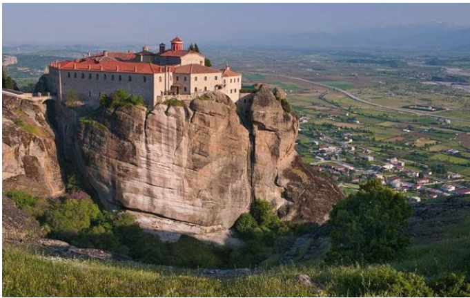
Mănăstirea Sf. Ștefan, Meteora, Grecia

Ea fost un loc de pelerinaj încă din secolul al XIV-lea, când împăratul bizantin Andronic Paleologul a vizitat și finanțat biserica originală. Construită în anul 1500, biserica adăpostește în prezent craniul Sfântului Charalambos, despre care se crede că ar avea puteri vindecătoare. Mănăstirea a suferit daune serioase în secolul XX: a fost bombardată în timpul celui de-al Doilea Război Mondial de către germani în timp ce mai multe fresce au fost deteriorate de către comuniști în perioada Războiului civil din Grecia. Mănăstirea a fost practic abandonată până în anul 1961, când a devenit un lăcaș pentru călugărițe. Sala de mese care datează din secolul al XV-lea a fost transformată într-un muzeu, în care sunt expuse robe fin brodate și tapiserii. Drumul către mănăstire este considerabil ușurat de un pod care face legătura cu drumul principal. Măicuțele întâmpină vizitatorii și, uneori, îi îmbie cu broderii manufacturate.