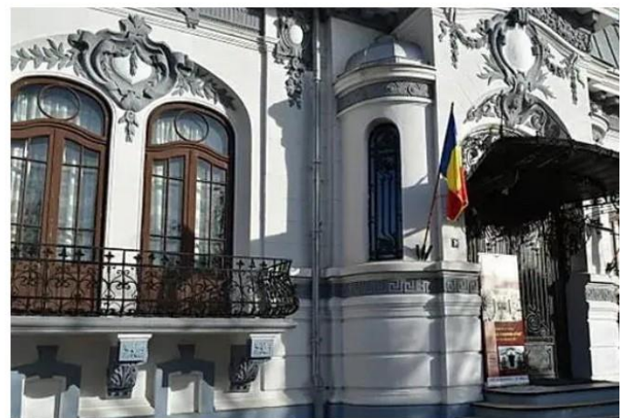
Situl Casa Romanței - Târgoviște, captură ecran ( https://muzeu-dambovitene.ro/muzeu/casa-romanței/ )