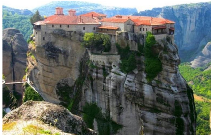
Mănăstirea Marele Meteoron, Meteora, Grecia

A doua cea mai mare mănăstire din Meteora, Varlaam, ne oferă o imagine despre dificultățile pe care le-au întâmpinat călugării atunci când au construit aceste sanctuare pe stânci. A durat 22 de ani pentru a aduce cu scripetele toate materialele necesare în locul în care avea să înceapă construcția. Scripetele care utiliza un coș din frânghii pentru aprovizionare este prezent azi în muzeu. Până în secolul XX, singura modalitate prin care vizitatorii puteau să ajungă la mănăstire, era să fie ridicați și ei, prin aceleași mijloace, într-un coș din frânghii. Astăzi, 195 de trepte sculptate în piatră duc către vârf. Înăuntru, frescele acoperă pereții capelei principale, incluzând desene ce înfățișează scene ale apocalipsei.