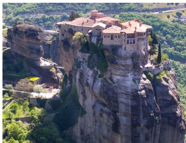
Mănăstirea Varlaam, Meteora, Grecia

A doua cea mai mare mănăstire din Meteora, Varlaam, ne oferă o imagine despre dificultățile pe care le-au întâmpinat călugării atunci când au construit aceste sanctuare pe stânci. A durat 22 de ani pentru a aduce cu scripetele toate materialele necesare în locul în care avea să înceapă construcția. Scripetele care utiliza un coș din frânghii pentru aprovizionare este prezent azi în muzeu. Până în secolul XX, singura modalitate prin care vizitatorii puteau să ajungă la mănăstire, era să fie ridicați și ei, prin aceleași mijloace, într-un coș din frânghii. Astăzi, 195 de trepte sculptate în piatră duc către vârf. Înăuntru, frescele acoperă pereții capelei principale, incluzând desene ce înfățișează scene ale apocalipsei.