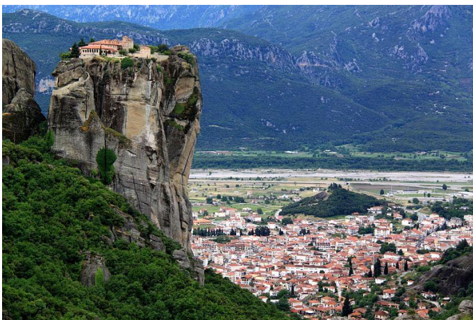
Mănăstirea Sfintei Treimi, Meteora, Grecia Imagine luată de pe tuktuk.ro

Mănăstirea Sfintei Treimi este probabil cea mai ușor de recunoscut dintre toate mănăstirile aflate la Meteora. Situată pe vârful unei culmi singuratică, este o adevărată provocare pentru vizitatori. Din parcare, aceștia coboară 140 de trepte până la o râpă, apoi urcă alte 140 de trepte pentru a ajunge la mănăstire. Deși dificil, acest traseu merită efortul. Datorită camerelor sale boltite, frescelor restaurate complet în secolul al XVII-lea și priveliștilor minunate, Mănăstirea Sfintei Treimi răsplătește vizitatorii printr-o experiență ce nu poate fi uitată curând.