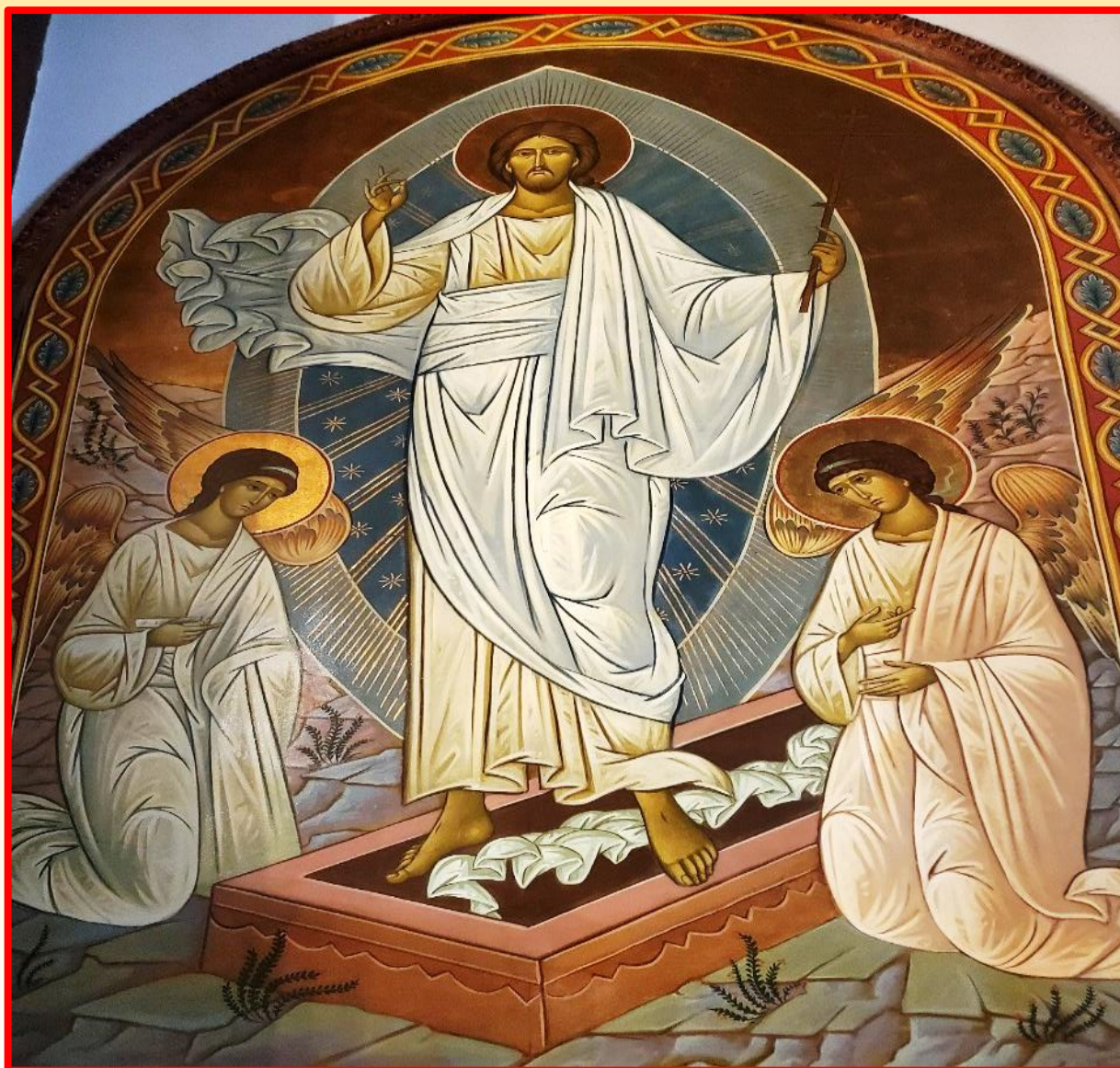
Icoana Învierii Domnului din Catedrala „Buna Vestire”, Montreal

„Hristos a Înviat din morți cu moartea pe moarte călcând și celor din morminte viață dăruindu-le”